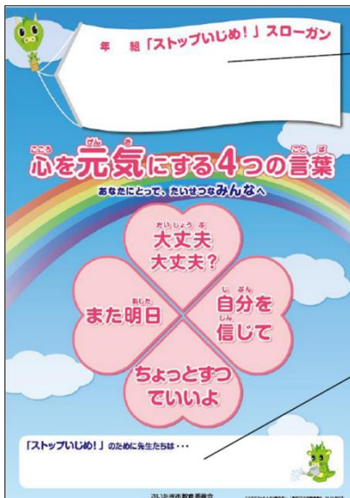
○全学級でのスローガングク